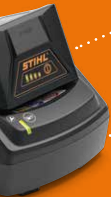
Ladegerät AL 101 € 49,-