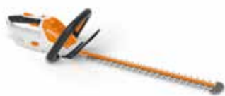
Akku-Heckenschere HSA 45 € 129,-

Leichte Akku-Heckenschere mit guter Schnittleistung zum Trimmen von Zweigen und dünnen Ästen. Einseitig geschliffene Doppelhubmesser, integrierter Schnitt- schutz, aufgeschraubter Führungsschutz, integrierter Akku mit Ladezustandsanzeige.